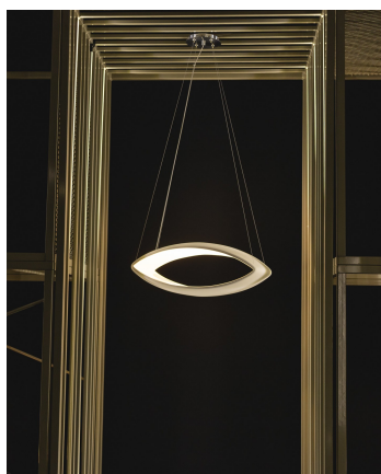
La lampada Nisha.