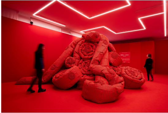
L'installazione dei Fratelli Campana per Melissa.

preservare l'eredità dei due fratelli usando il design come strumento di trasformazione attraverso progetti sociali ed educativi.