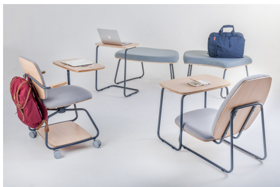
La collezione Jataí di Maqmóveis

Maqmóveis mette in mostra al Fuori Salone nove pezzi d'arredo di quattro tipologie di prodotti. Oltre alla premiata sedia Jataí, ci sarà una poltroncina bassa con tavolino (ideale per sedersi a terra in situazioni più rilassate), tre sedute tradizionali - in diverse misure per le varie età - e pouf modulari.