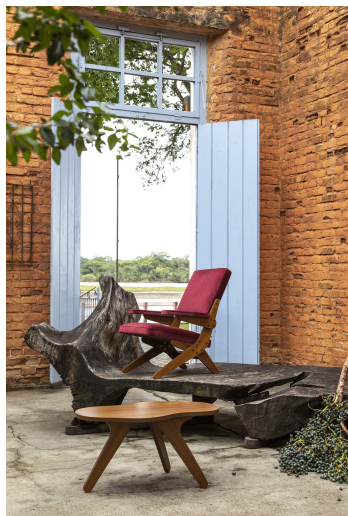
Complementi di Zanine Caldas

Un altro appuntamento celebra infine il centenario della nascita del rivoluzionario architetto e designer brasiliano José Zanine Caldas (1919 - 2001). ETEL, l'unico brand autorizzato a rieditare i pezzi di grandi maestri del design del Brasile, inserisce 20 icone di Zanine nella sua collezione, già ricca di tutti i nomi più significativi della cultura progettuale del paese, come Jorge Zalszupin, Lina Bo Bardi, Giuseppe Scapinelli e Oscar Niemeyer.