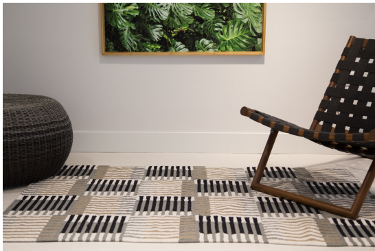
Renata Rubim