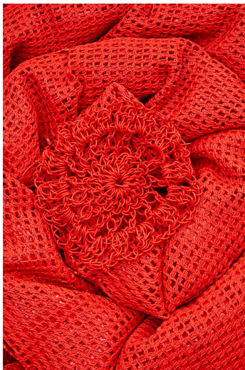
Fratelli Campana per Melissa.